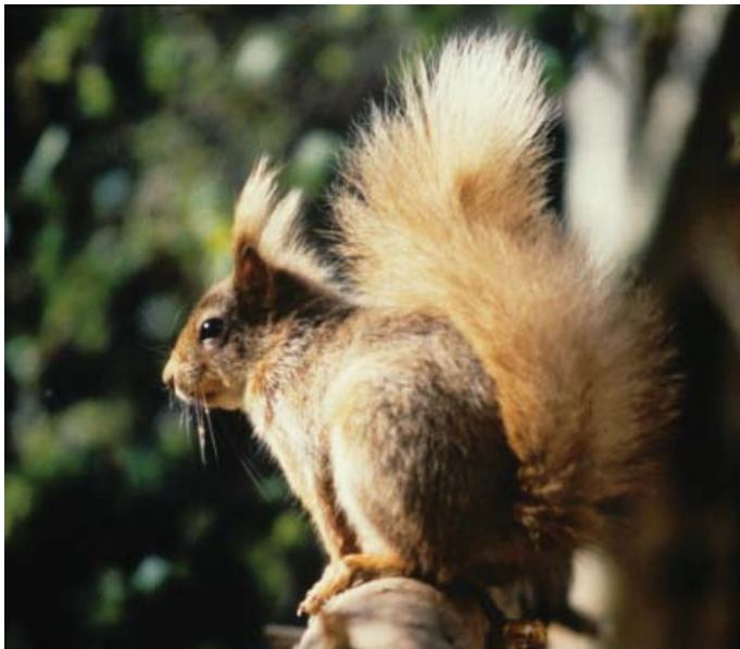
LLun / Photo: Kevin Cook