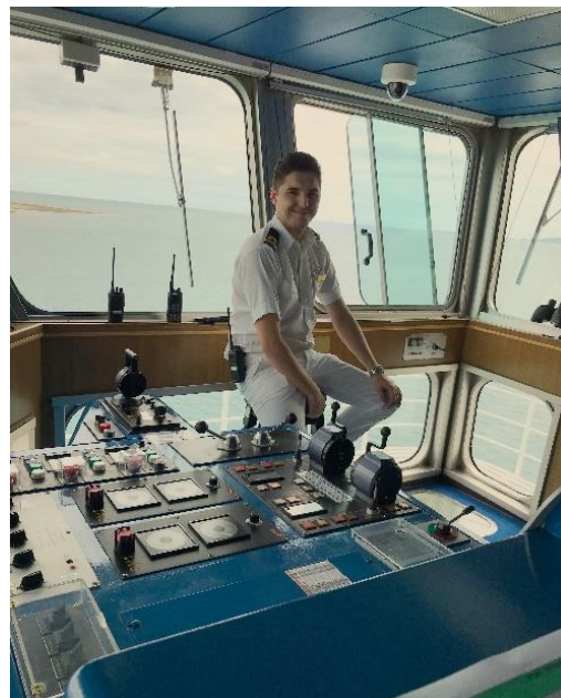
Owen ar wylidwriaeth angor ar bont lywio yr M.V. Pacific Aria yn Ffiji.

Mae'r Tîm Gwasanaethau Harbyrau wedi bod yn gweithio gydag Asiantaeth y Môr a Gwylwyr y Glannau i adolygu ein Cynllun Rheoli Gwastraff Porthladdoedd. Ein nod yw datblygu a gweithredu cynllun cydsyniol sy'n rhoi cyfleusterau gwastraff priodol a digonol i ddefnyddwyr harbyrau. Bydd y Cynllun yn helpu i gadw ein harfordir hardd yn lân ac yn glir o wastraff. Bydd y Cynllun yn cael ei gyhoeddi a'i rannu gyda'r defnyddwyr harbyrau yn y misoedd nesaf.