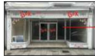
SECURITY GRILLE Shows position of colour coated aluminium roller shutter grills to cover recessed entrance lobby. Grills to be recessed into soffits of entrance lobby ceiling beams.