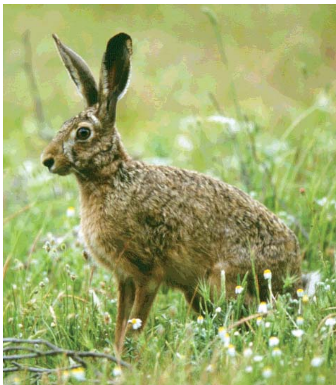
L Lun