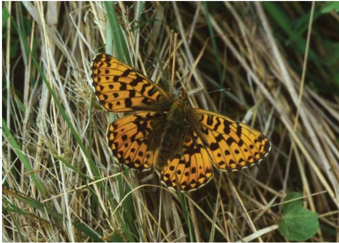
L Lun